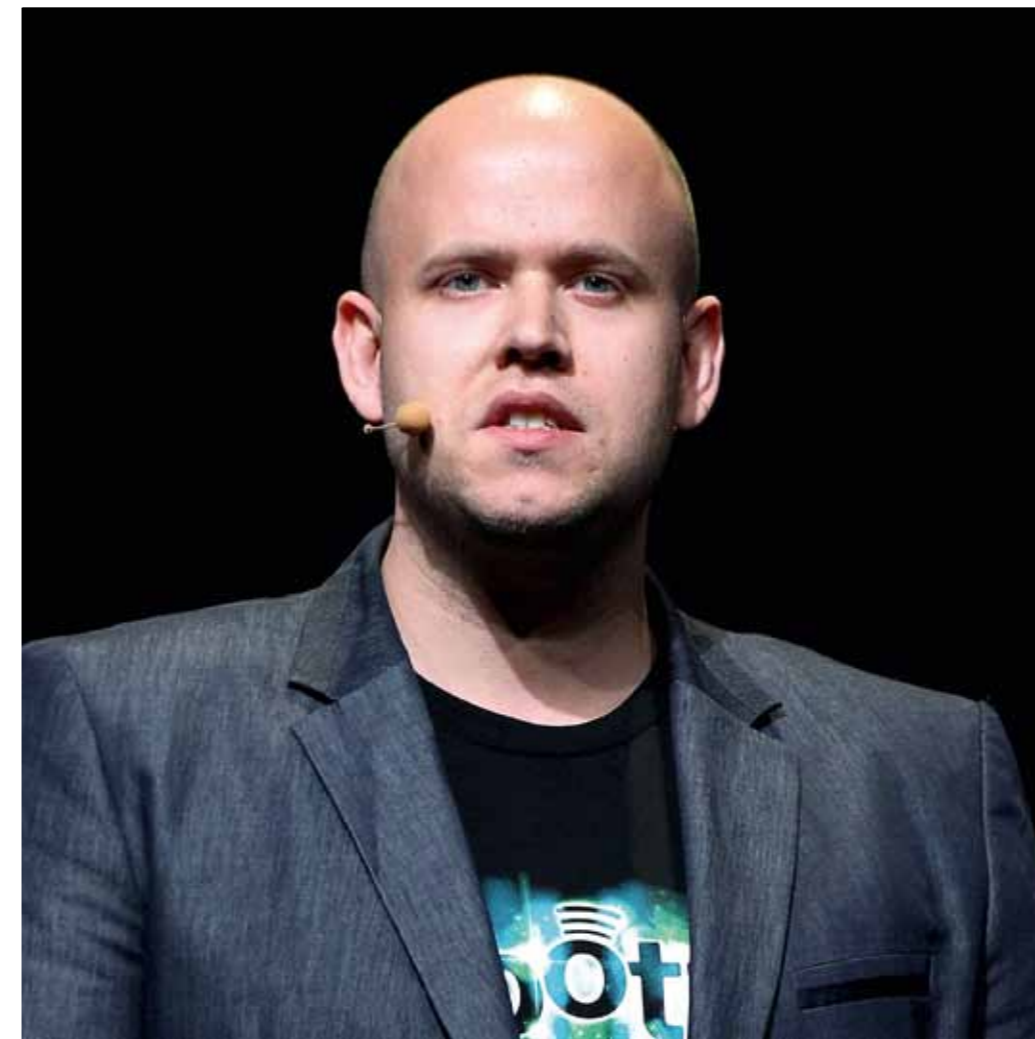
Daniel Ek (1983), medeoprichter en CEO van Spotify. Deze Zweedse programmeur startte drie internetbedrijven en verkocht ze ook weer voor hij met Martin Lorentzon in 2006 Spotify begon, een streaming muziekdienst. Na de nodige tegenwerking vanuit de muziekindustrie, wordt hij wel 'de redder van de muziek' genoemd. Of hij de nieuwe Steve Jobs is? Bij Spotify zijn ze ervan overtuigd dat Jobs heeft geprobeerd muziekmaatschappijen over te halen geen zaken te doen met Spotify, ten gunste van Apple's eigen iTunes. Dus...